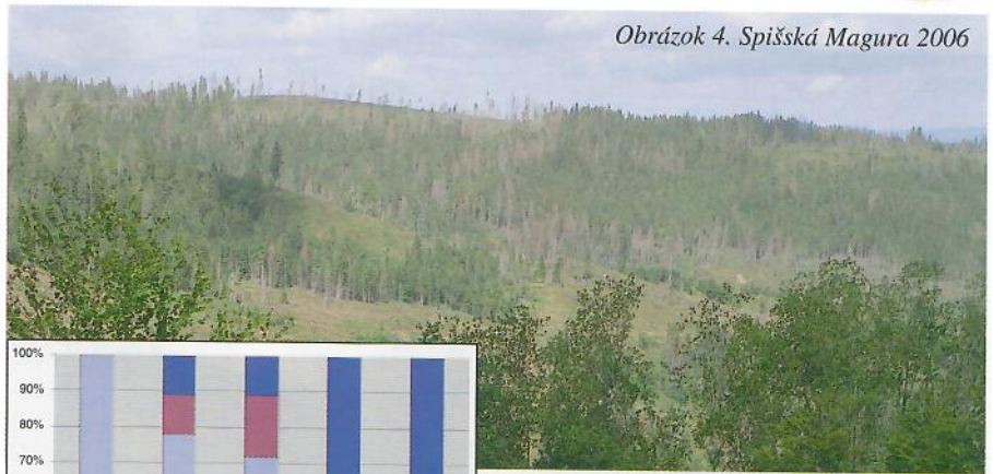
Obrazok 4. Spišská Magura 2006

Z hľadiska prevencie premoženia podkôrníkov za negatíva možno považovať aj zdĺhavý administratívny postup zo strany orgánov životného prostredia pri posudzovaní a vybavovaní žiadostí o spracovanie kalamitnej hmoty v chránených územiach, o sprístupnenie porastov, pozemnú i leteckú aplikáciu insekticidov, inštaláciu feromónov a podobne. Súhlasy (resp. výnimky) podľa zákona č. 543/2002 Z.z. o ochrane prírody a krajiny v mnohých prípadoch neboli poskytnuté, alebo boli udelené neskoro a v boji proti podkôrníkom stratili aktuálnosť. V prospech rozvoja populácie podkôrneho hmyzu hovoria i objektívne skutočnosti, súvisiace s rozsiahlou kalamitou.