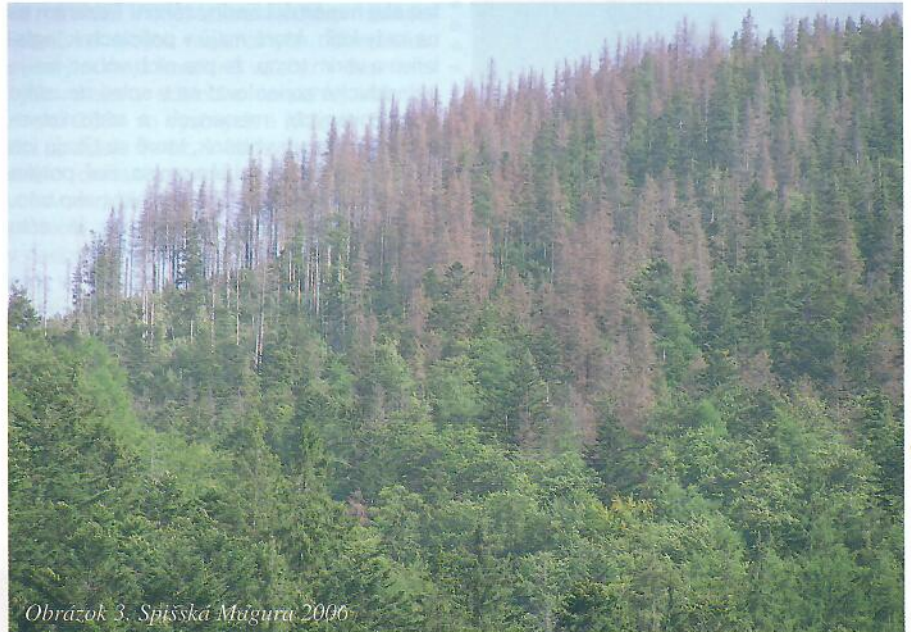
Obrázok 3. Spišská Magura 2006

Realizovali sa aj ďalšie opatrenia. Napríklad v dňoch 20.-23. júla 2005 bola v súlade s rozhodnutiami ObÚ ŽP vykonaná letecká chemická aplikácia vrtuľníkom Mi-2. Vrtuľníkom boli proti podkôrny a drevokazným škodcom ošetrené všetky stojace porastové steny sústredených kalamit v piatich LHC Odštepného závodu Beňuš na rozlohe 404 ha. Vo všetkých OZ postihnutých veternou smrťou (Beňuš, Čierny Balog, Liptovský Hrádok, Námestovo, Revúca, Rožňava), najmä v porastoch s roztrúsenou kalamitou bola zrealizovaná pozemná chemická aplikácia farebne upraveným prípravkom. Celkom bolo chemicky ošetrených 185 895 m 3 roztrúsennej kalamitnej hmoty.