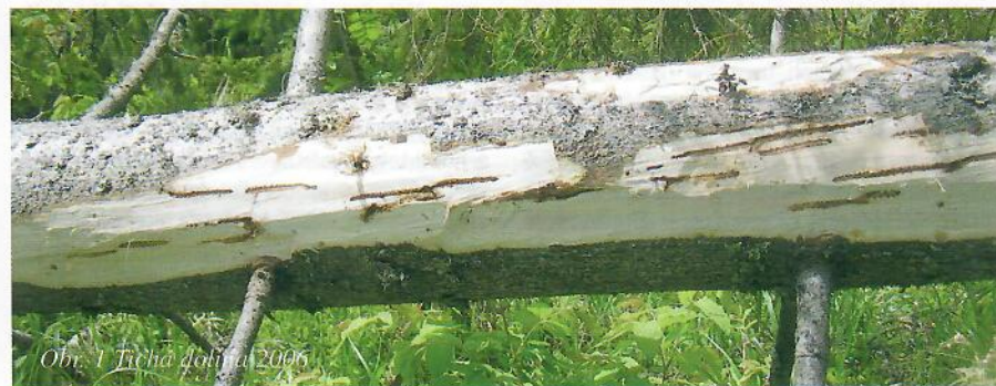
Obr. 1. Tichá dolina 2006

Spracovanie kalamity napredovalo veľmi dobre. V ŠL TANAP bolo na rok 2005 harmonogramom stanovené spracovať 70 % hmoty z vetrovej kalamity, čo z celkových 2,03 mil. m 3 predstavovalo 1,421 mil. m 3 dreva. Za obdobie roku 2005 sa nakoniec spracovalo 1,667 mil. m 3 . Spolu s objemom dreva spracovaným v roku 2004 sa spracovalo 85,8 % celkového objemu kalamitného dreva. V rámci nešťátnych subjektov z celkového množstva kalamity 1 276 tis. m 3 , bolo spracovaných 1 071 tis. m 3 , čo je 83,9 %. V rámci Lesov SR. š. p. z evidovaných 1 994 tis. m 3 kalamitného dreva bolo spracovaných 1 859 tis. m 3 , čiže 93,2 %. V ŠL TANAP sprevádzkovali spolu 3 500 feromónových lapačov, Lesy SR š. p. v kalamitných plochách nainštalovali 17 141 feromónových lapačov, a tisíce ich inštalovali nešťátni subjekty.